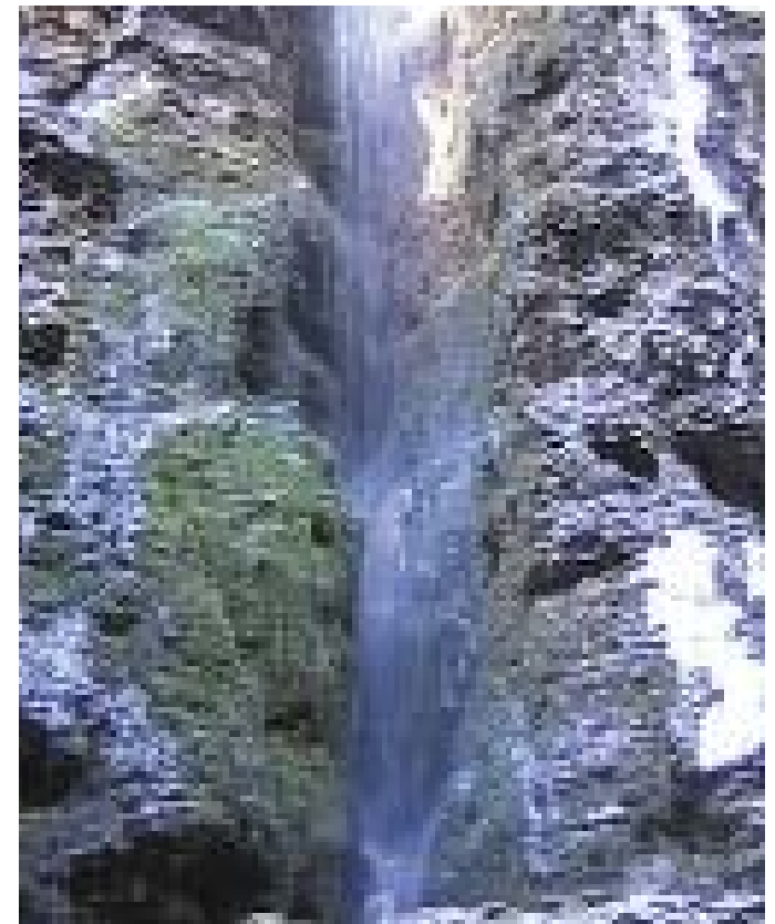
Wolfgang Wohlfahrt, Water transfer, 2002, Video, 75Min.

Der Moment des Richtungswechsels bietet die Möglichkeit, eine Bewegung sowohl nach Innen, als