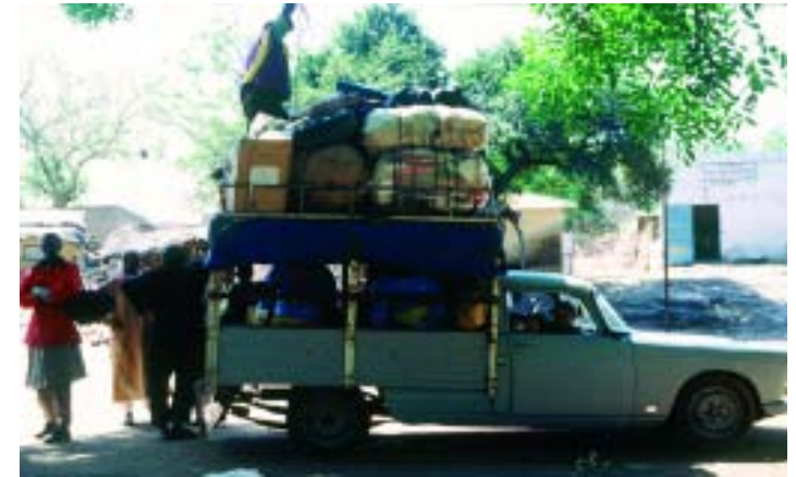
Wolfgang Wohlfahrt, 5 Fotoarbeiten, auf Aluminium, a 30 x 40 cm, Installation