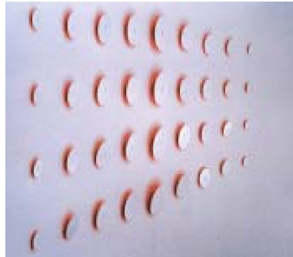
Na@tura, 11- teiliges Ensemble, Holz, Steintafeln, Zwiebeln, Videos, Performances, Musik, Literatur, Ausstellung im Wasserturm, Wien, 2001