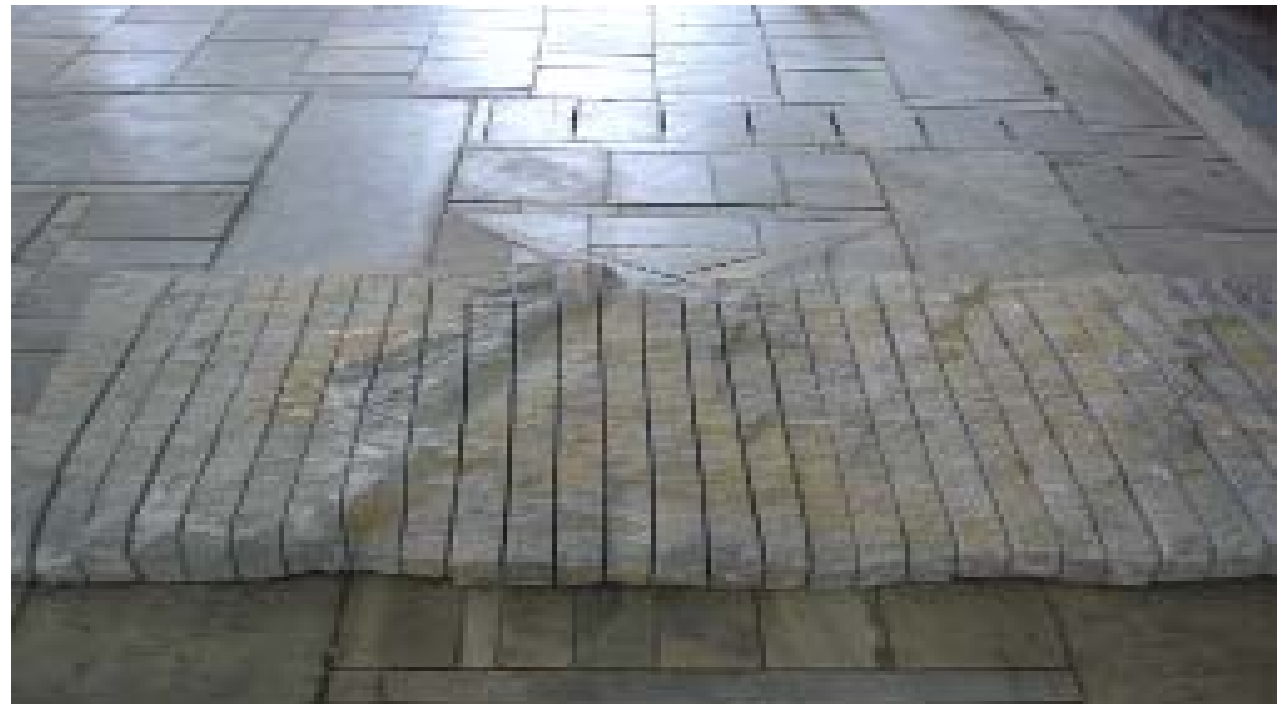
Wolfgang Wohlfahrt, Besser schlafen, Marmor, 200 x 110 x 15 cm