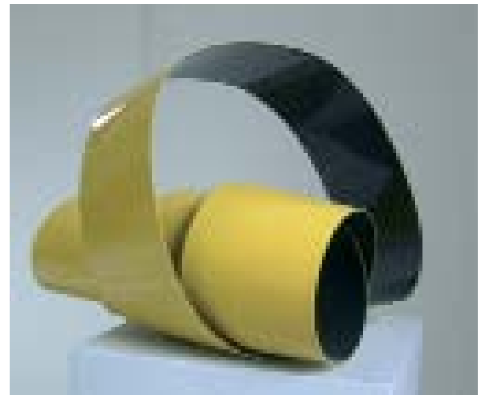
Wolfgang Wohlfahrt, Drehung, 2002, Stahl, 42 x 42 x 52 cm