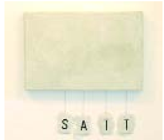
Wolfgang Wohlfahrt, satt, 2005 Mischtechnik, 40 x 50 cm

03.07. - 30.07.2005 Mitgliederausstellung