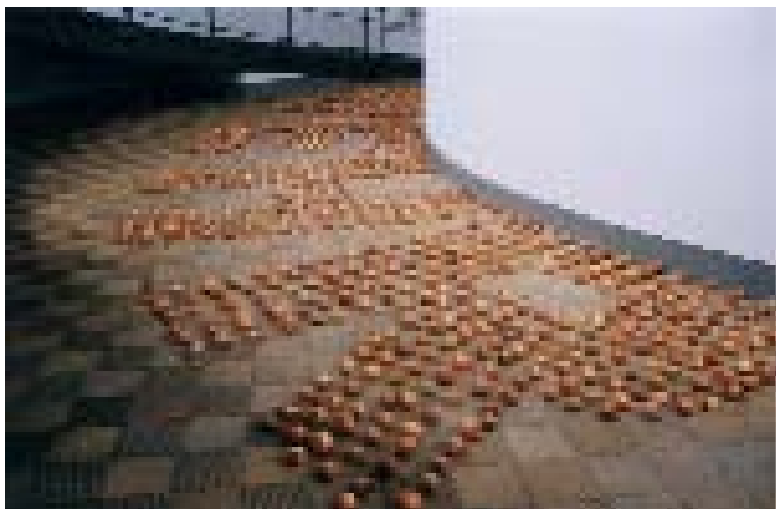
Na@tura, mehr denn je, Zwiebeln, Videos, Performances, Musik, Literatur, Ausstellung im Wasserturm, Wien, 2001